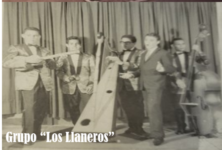
Grupo “Los Llaneros”